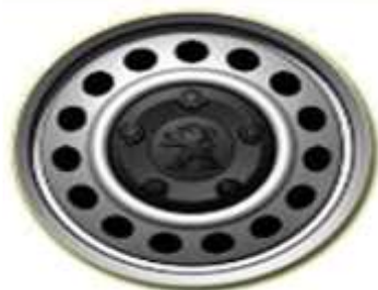
Стоманена джанта с черни болтове 16"