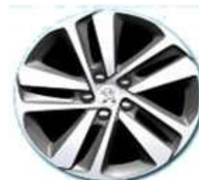
Алуминиева джанта 17"