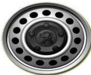
Стоманена джанта с черни болтове 17"